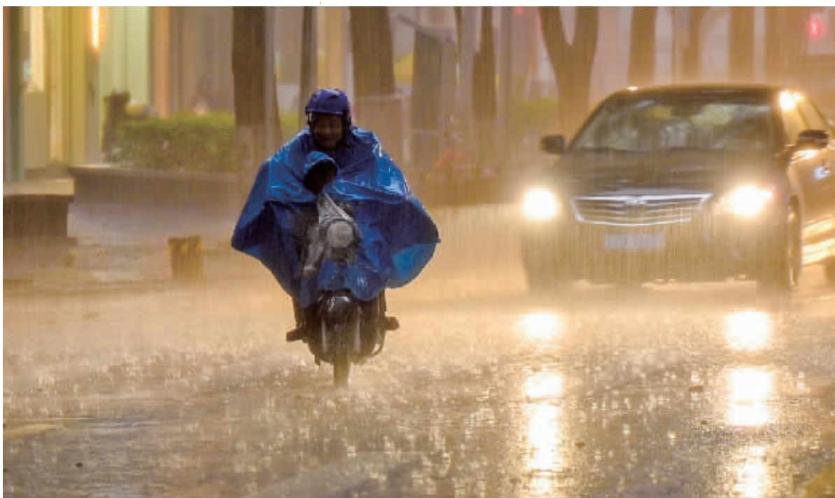
雨势短时间内非常大。