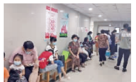
妇儿医院发热门诊接待的患儿数量明显增加。