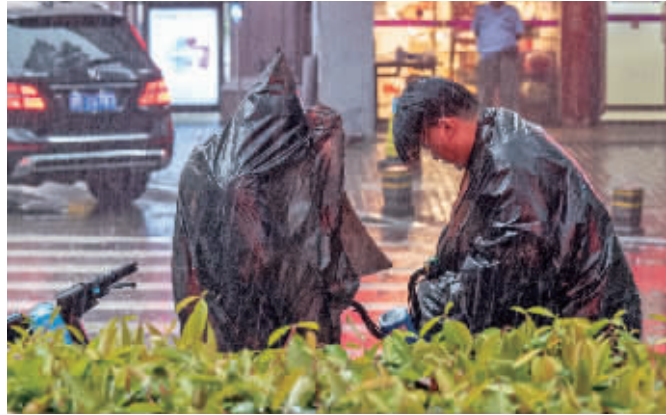
突然倾盆大雨,行人赶紧穿上雨衣。