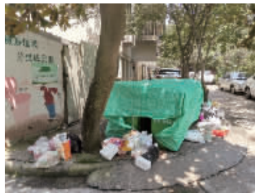
鄞州演武花园垃圾桶旁放着20多个垃圾袋。