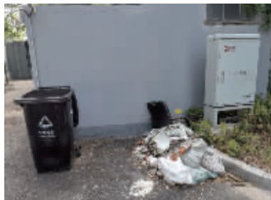
海曙尹江岸社区这样的垃圾堆随处可见。