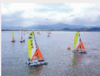
宁波湾 通讯员 王璐