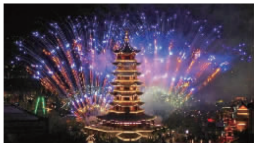
东方神画主题公园