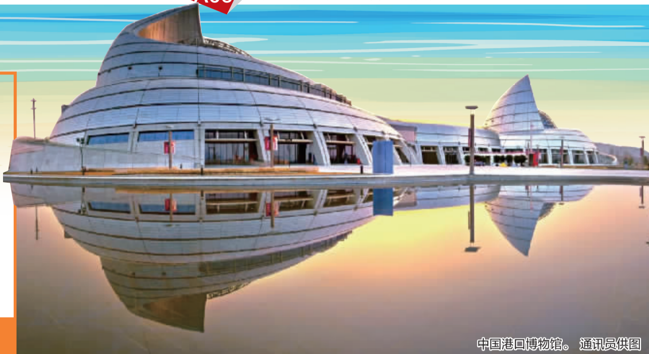
中国港口博物馆。