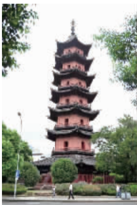
如今的天封塔。(资料图片)

7月12日至14日,随着2022亚洲海洋旅游发展大会在宁波的召开,“港通天下”的甬城再次吸引了来自全球的目光。在首届亚洲海洋旅游发展大会召开之际,就让我们回到梦开始的地方,讲述宁波先民与海洋,宁波与港口的那些故事。