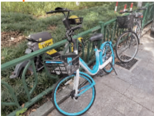
江北日湖家园门前的绿化带内外,随意停放着自行车。

楼道停车、堆放杂物、乱扔垃圾……日前,记者走访了市区20多个社区,发现其中7个或多或少存在这些问题。那么,小区外围的情况如何呢?记者在走访中发现,堵塞消防车道、占用绿地或人行道停车、停车位或健身场地成晾晒场等情况比较常见。