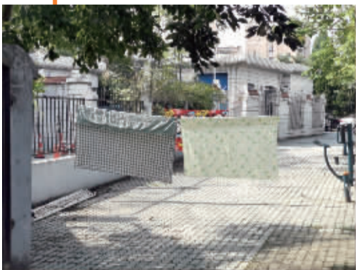
海曙中山雅园外的健身场地成了晾晒场。