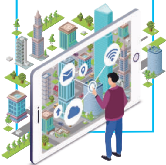
未来社区智慧服务平台框架图

“鄞州区未来社区智慧服务平台建设，是我区未来社区实施数字化部分的基础核心，我们计划在8月底前上线部分功能，让居民率先体验数字化给生活带来的便捷。整个平台计划今年11月底前交付使用。”鄞州区住建局相关负责人表示。