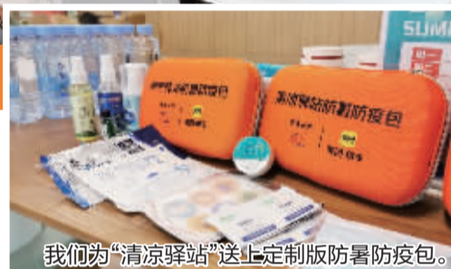
我们为“清凉驿站”送上定制版防暑防疫包。

“我们可以给大家提供绿豆汤!”“我们的清凉驿站,每天送定制凉茶!”这段时间,宁波连续高温,暑热难耐。“清凉驿站”征集令发起后,全市推出了138个“清凉驿站”,让大家都能在家门口享受“清凉”。