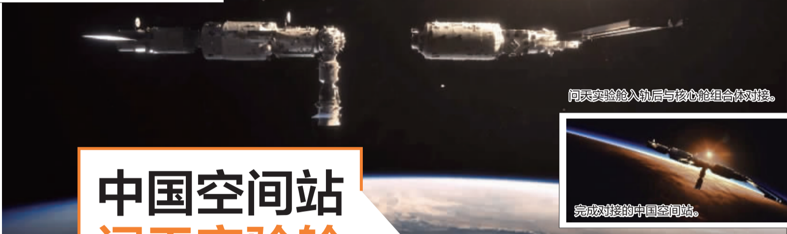
问天实验舱入轨后与核心舱组合体对接。