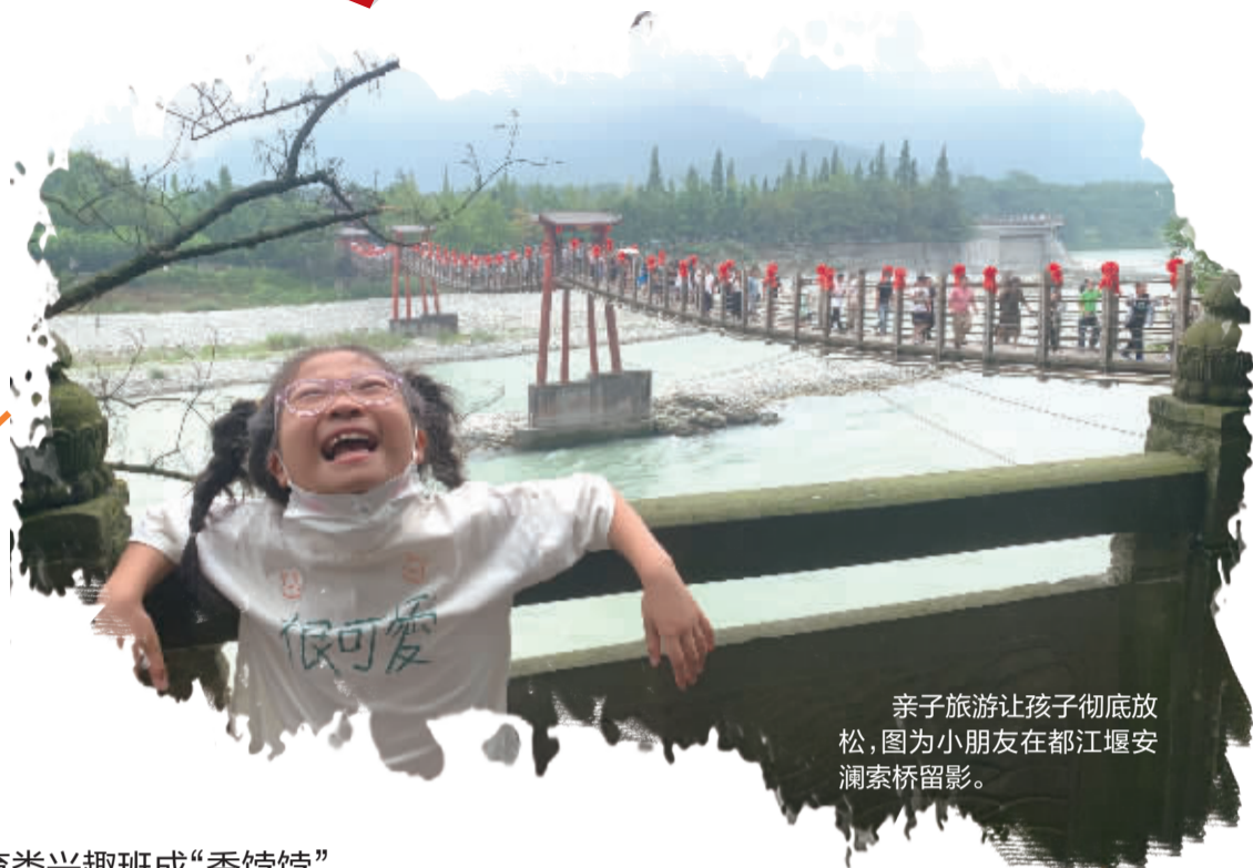
亲子旅游让孩子彻底放松，图为小朋友在都江堰安澜索桥留影。

亲子旅游、参加夏令营、报兴趣班、治疗近视、矫正牙齿……暑假是孩子们的开心长假，也是家长们一年中给娃花钱的高峰期。