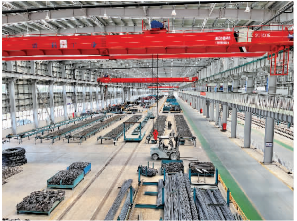
建筑预制件加工车间。

一片30米T梁成功下线，即将交付10公里外的象山湾疏港高速公路的项目标段。7月28日上午，在炎炎夏日里，位于鄞州滨海交通产业基地的甬科交通工业公司，这个国内首座交通基建“超级工厂”正开足马力，迎接施工建设的集中交付期。