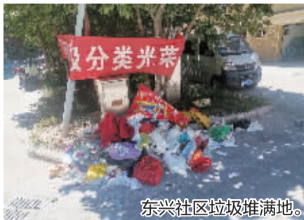
东兴社区垃圾堆满地。