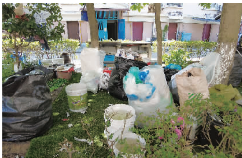
东裕新村D区绿化带堆放杂物。

除了有乱丢生活垃圾的情况,记者在该小区71幢和74幢居民楼之间的绿化带边,还看到一大堆杂物垃圾,有塑料袋和生活用品等,而垃圾堆旁边的树上还挂着“乱扔垃圾可耻,垃圾分类光荣”的横幅。