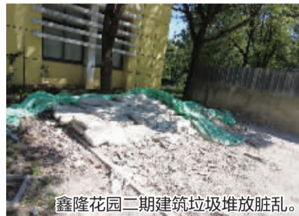
鑫隆花园二期建筑垃圾堆放脏乱。

8月5日,记者再次走进鄞州、镇海等地小区进行暗访,发现垃圾乱丢乱堆、占用绿化带等问题依然存在。