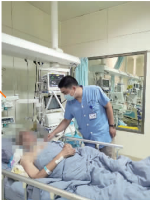
市二院急诊ICU近期收治了多例脑梗患者。

今年夏天,迟迟不下线的高温天气使得各医院的急诊室都格外忙碌。来自宁波市第二医院的统计数据示,该院急诊接诊量同比去年夏天增加三成左右,其中脑梗患者明显增多,近两个月每月收治近百名患者。急诊专家提醒,患有基础性疾病、身体比较弱的老年人是脑梗的高发人群,脑梗救治的黄金期是发病后的4.5个小时,大家要多注意身边老年人的异常表现。