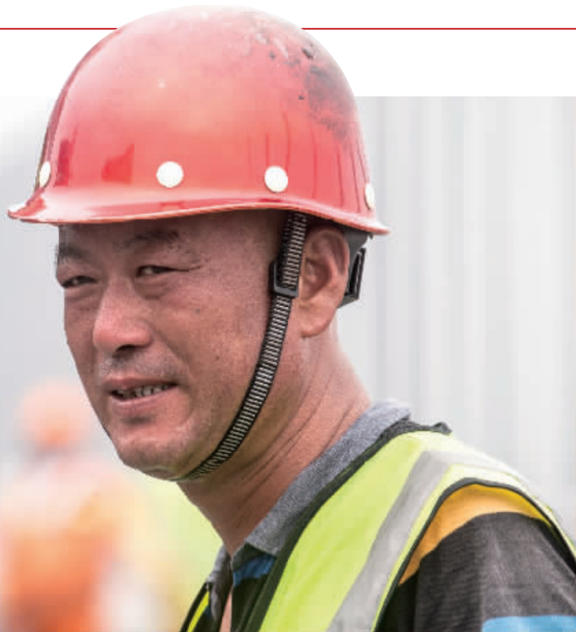
高架施工工地上，汗如雨下的建筑工人。

“太意外了，找了好几个工地都没有找到‘小候鸟’，这才发现，很多建筑工人已经是‘爷爷辈’了……”今年暑假期间，宁波一家企业打算开展一项关爱建筑工地“小候鸟”的活动，企业负责人在几经找寻无果后如此感叹。