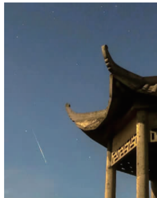
▲8月14日凌晨,鄞州横溪金山村望海亭,英仙座流星雨。