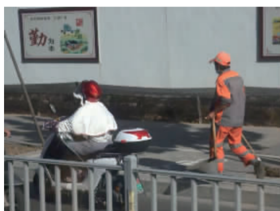
▲8月19日,江北孔浦,“勤”字标语下的路人和环卫工人。