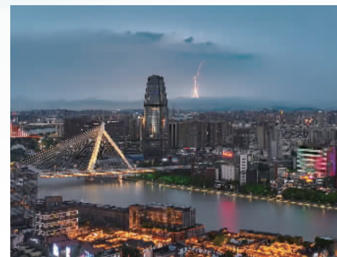
▲7月21日,三江口航拍到的天边闪电。凌齐亮 摄