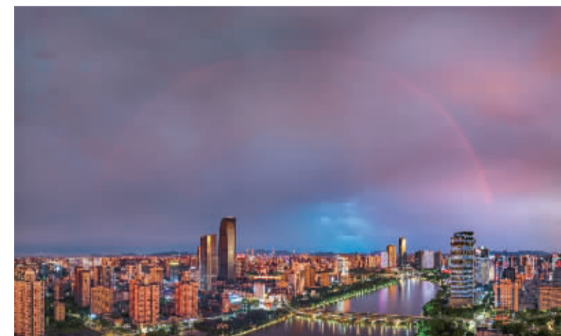
▲7月21日,三江口,雨后彩虹。

和这个夏天郑重地告个别 和挥汗如雨的自己说声感谢 和徐徐落下的 第一片叶子打声招呼 希望来年不要这么热 希望多年后回忆 这个夏天掉的每一滴汗 都值得