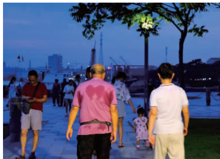
▲7月20日,镇海沿江路,汗水浸成一个“心”形。潘红伟 摄