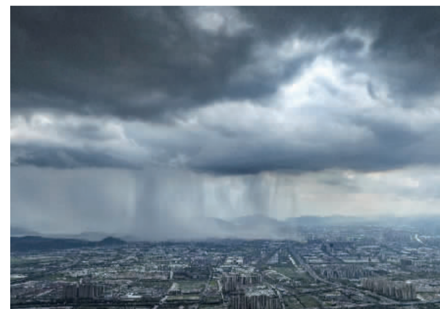
▲7月7日,在东部新城追雨。