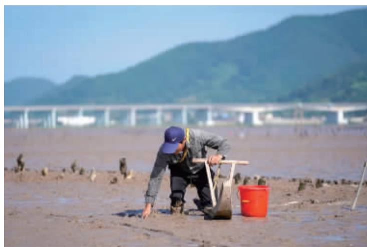
▲7月5日,象山黄避岙乡沪港村,烈日下的赶海人。