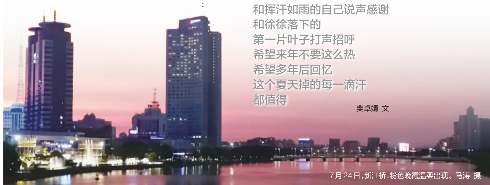
7月24日,新江桥,粉色晚霞温柔出现。