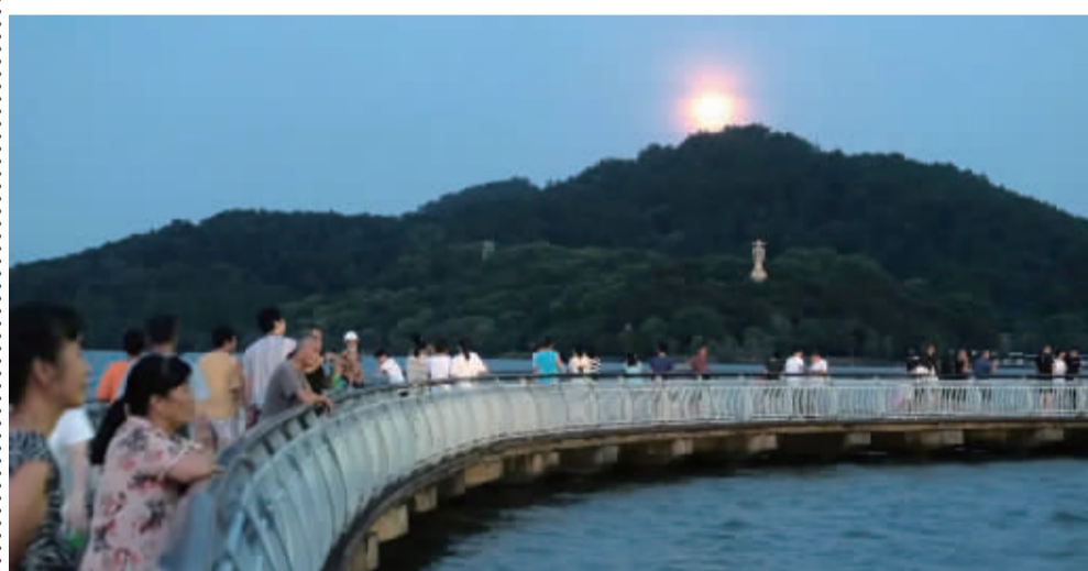
▲8月11日傍晚,东钱湖畔,纳凉的人一波又一波。胡龙召 摄