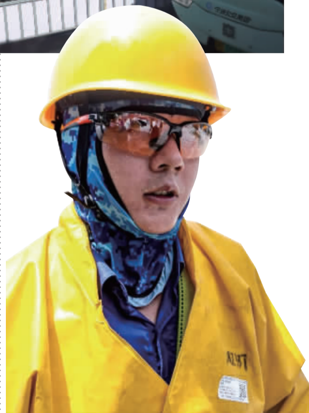
▲7月15日,鄞县大道,连续作业1小时后,电力工作人员的衣服已湿透。