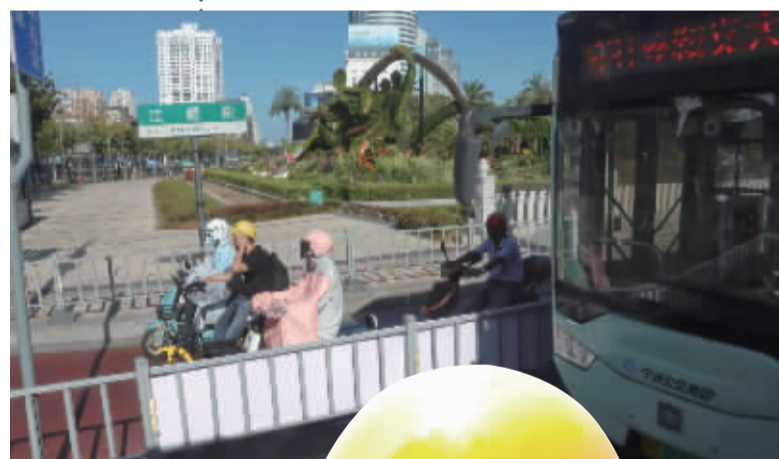
▲8月19日,东门口,有人“全副武装”,有人用手遮阳。