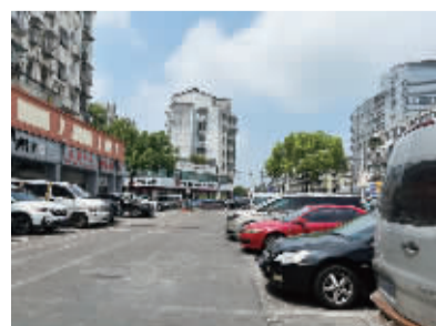
张斌桥菜市场北侧停车场有序停车。