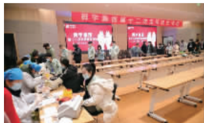
舜宇集团第十二次无偿献血活动现场。

在舜宇集团，有一项延续了22年的公益活动，那就是组织员工参与无偿献血。多少次，在余姚市血液偏少的时候，舜宇集团的员工集体挽起袖子献出热血，为拯救生命出一份力。据统计，从2000年至今，公司已有3800余人次参加献血，累计献血总量超95万毫升。