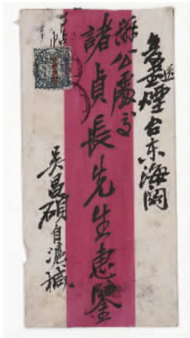
展览中的吴昌硕信札用了定制工艺。