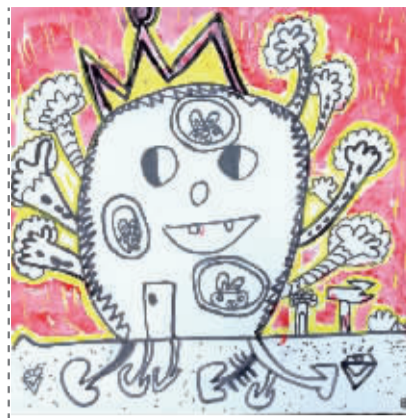
树墩墩 江北区中心幼儿园星星班 田景瑞(证号2200357) 指导老师 张蓓 李梦晗