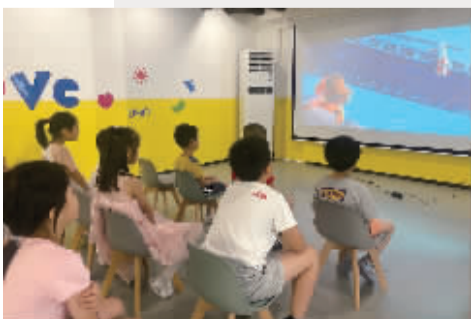
孩子们正在看动画片。