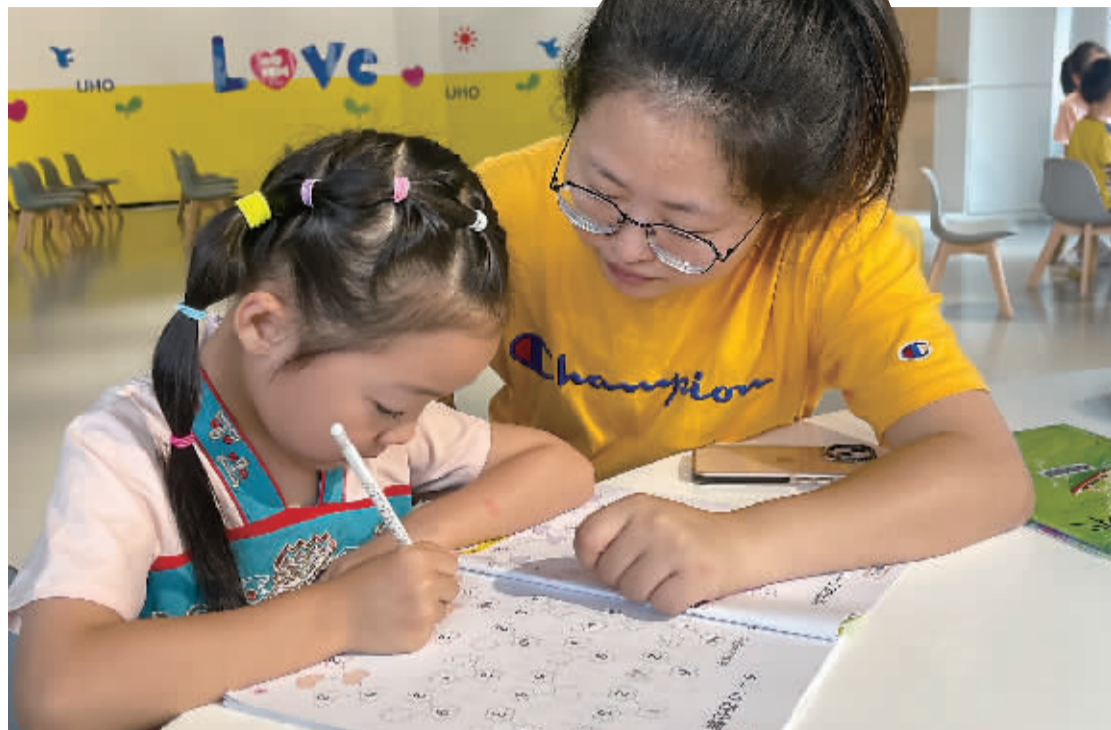
欢乐海岸社区未成年人活动中心,志愿者在辅导孩子做作业。