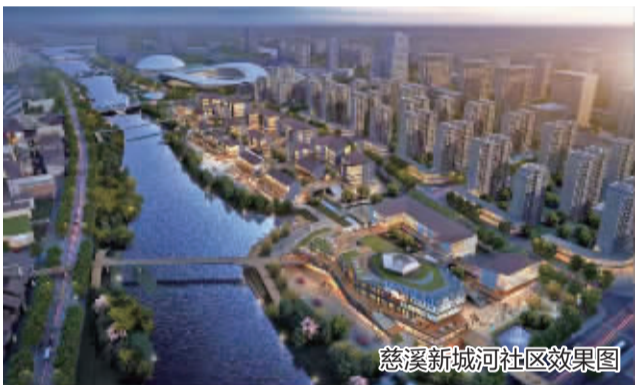
慈溪新城河社区效果图