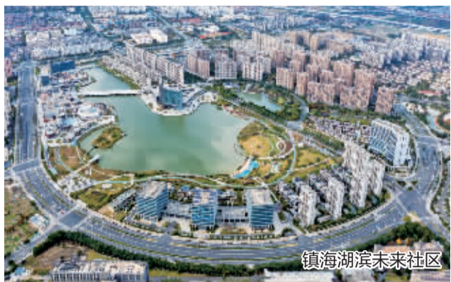
镇海湖滨未来社区

昨天,记者从市住建局获悉,根据省风貌办最新公布的《全域推进未来社区建设和城镇社区公共服务集成落地改革第一批试点名单》,宁波两地入选,分别是镇海区和慈溪市。