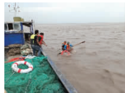
救援的渔船赶来,两人获救。