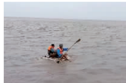
两人到滩涂挖泥螺,遇到大潮后陷入险境。