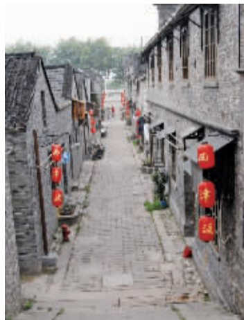
运河边上的镇江古渡