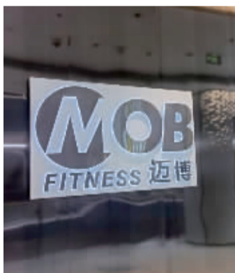
位于复悦城3楼的迈博健身门店。

确实存在很多不规范的做法,所以有关收费的问题,一定要有书面合同和正规发票作为凭证,而不能仅仅依靠销售人员的口头承诺。健身房出示的所谓定金收据是没有什么法律依据的,只有正规发票才具有。