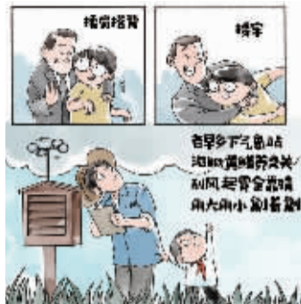
配音:方芝萍 漫画:任山殿

借助锄头打蛇,叫劊。譬如一梗(条)蛇,锄头劊其煞。宁波老话:呖角锄头乱劊。意思是瞎