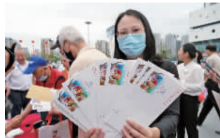
首发仪式现场。