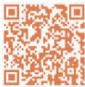
扫码了解 更多内容

老外滩的沉浸式剧场入戏·老外滩已运营一段时间，国庆期间将上新一部沉浸式悬疑戏剧《切西娅》。该剧将戏剧与剧本推理结合，全场观众将化身侦探，沉浸于推理世界。 记者 顾嘉懿