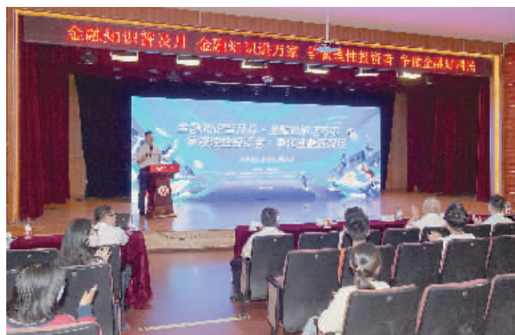
金融专家在宁波财经学院宣讲金融知识。

在宁波财经学院会堂门口,工行宁波市分行的青年志愿者还设立金融知识普及专区,通过向过往的学生发放宣传折页以及开展有奖答题等形式,鼓励该校学生主动参与到金融知识的学习和实践中,学以致用,提高风险防范意识。 记者 周雁 通讯员 沈颖俊 章羽彬