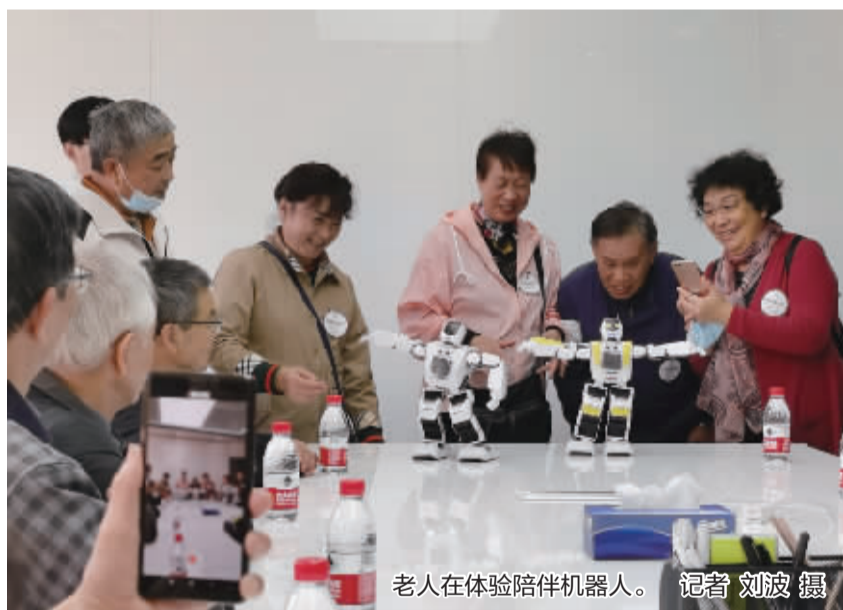
老人在体验陪伴机器人。