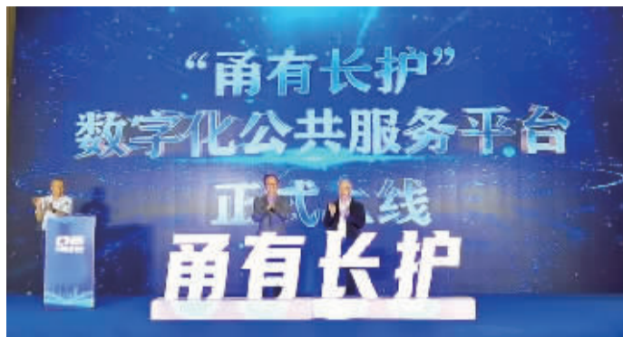
「甬有长护」平台上线。

市民如何通过“甬有长护”平台申请长期护理保险?在活动现场,该平台相关负责人就具体操作步骤进行了详细演示。据悉,“甬有长护”平台的手机端APP将很快在应用市场上架。