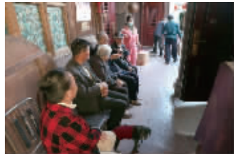
搬离前,老邻居们在一起聊天。