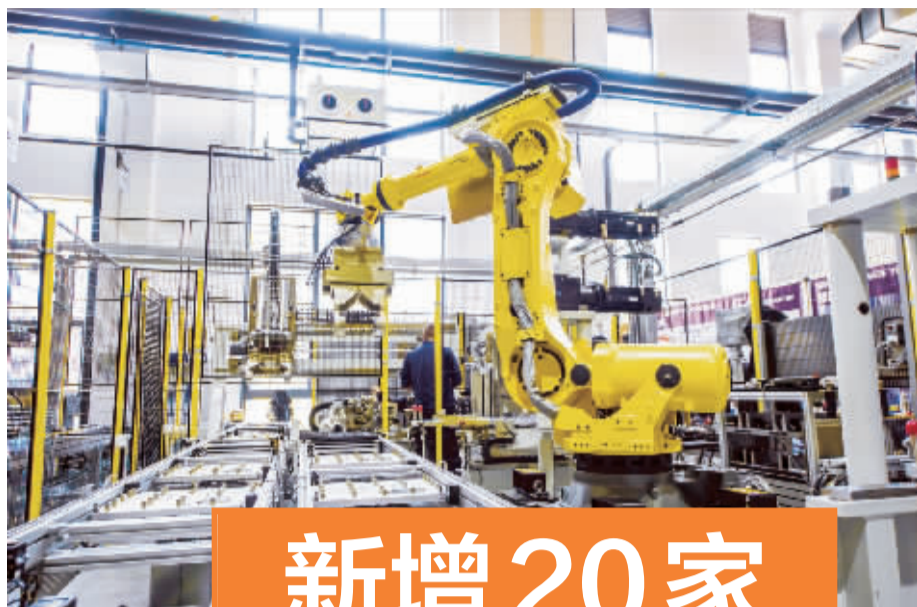
均胜群英车间生产线。