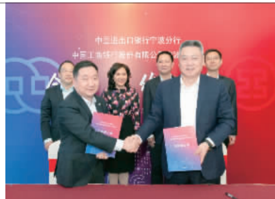
工行宁波市分行与中国进出口银行宁波分行举行合作备忘录签约仪式。

此次签约,双方将进一步巩固、扩大双方已有的合作成果,在更高层次上、更广范围内实现业务优势互补、强强联合。进一步聚焦长三角、长江经济带、共同富裕示范区、中国(浙江)自由贸易试验区宁波片区