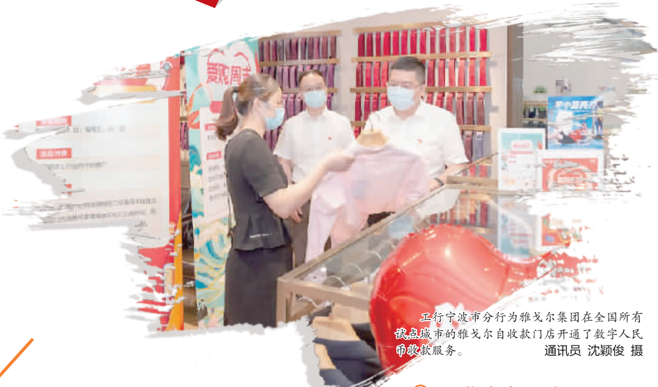
工行宁波市分行为雅戈尔集团在全国所有试点城市的雅戈尔自收款门店开通了数字人民币收款服务。

工行数字人民币试点推广成功迈出了从无到有的第一步,正逐步向“从有到优”跃进。截至目前,已累计开立个人钱包68.6万个,对公钱包1.98万个,支持数字人民币受理的商户达1.23万户,累计交易金额3.98亿元,累计交易笔数27.8万笔。