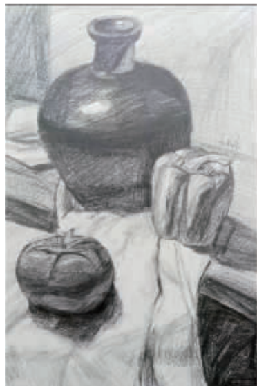
花瓶边的果蔬 鄞州区钟公庙实验小学502班 马季月(证号2201241) 指导老师 黄静静