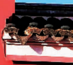
蓝天之下的城隍庙红色外墙。