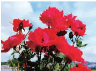
东钱湖边的红色月季花开得正艳。