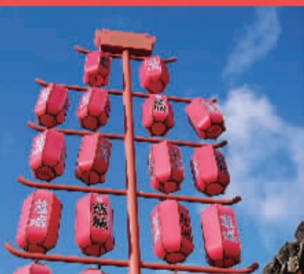
慈城古镇上的红色灯笼。