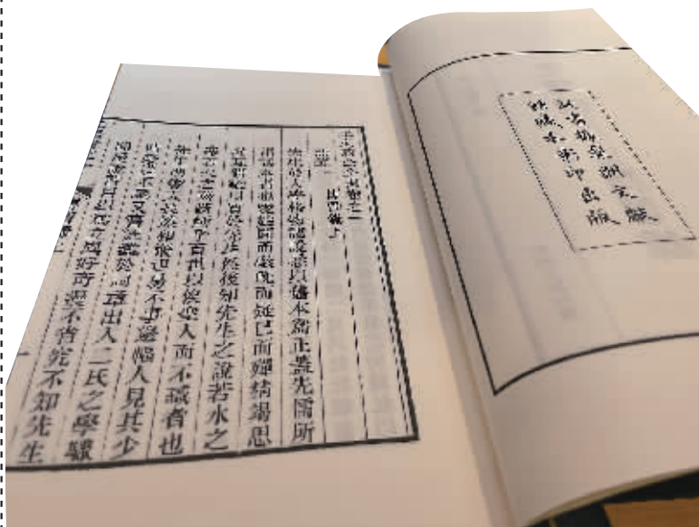
《王阳明先生传习录》影印本。