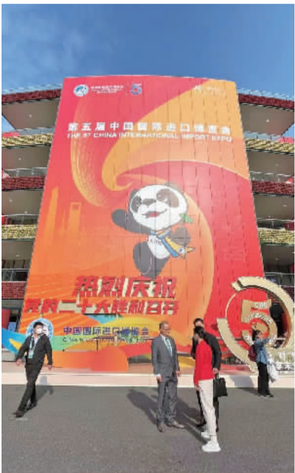
第五届进博会现场。

作为全球首个主题为进口的国家级展会，进博会的溢出效益，让越来越多宁波企业共享开放机遇。因外形而得名“四叶草”的国家会展中心（上海），也成为宁波交易团6000余位采购商“买全球、卖全球”的舞台。