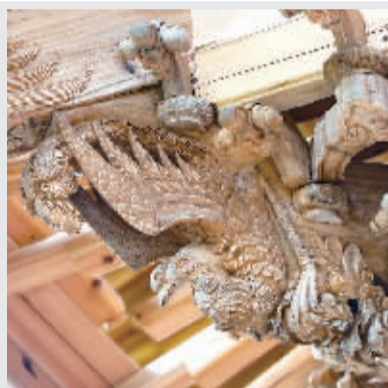
戏台局部构件,细致精巧,栩栩如生。