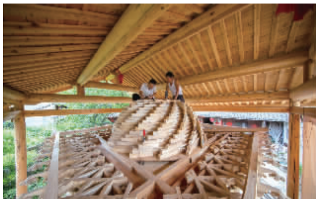
▶ 2021年7月16日,戏台初见雏形。