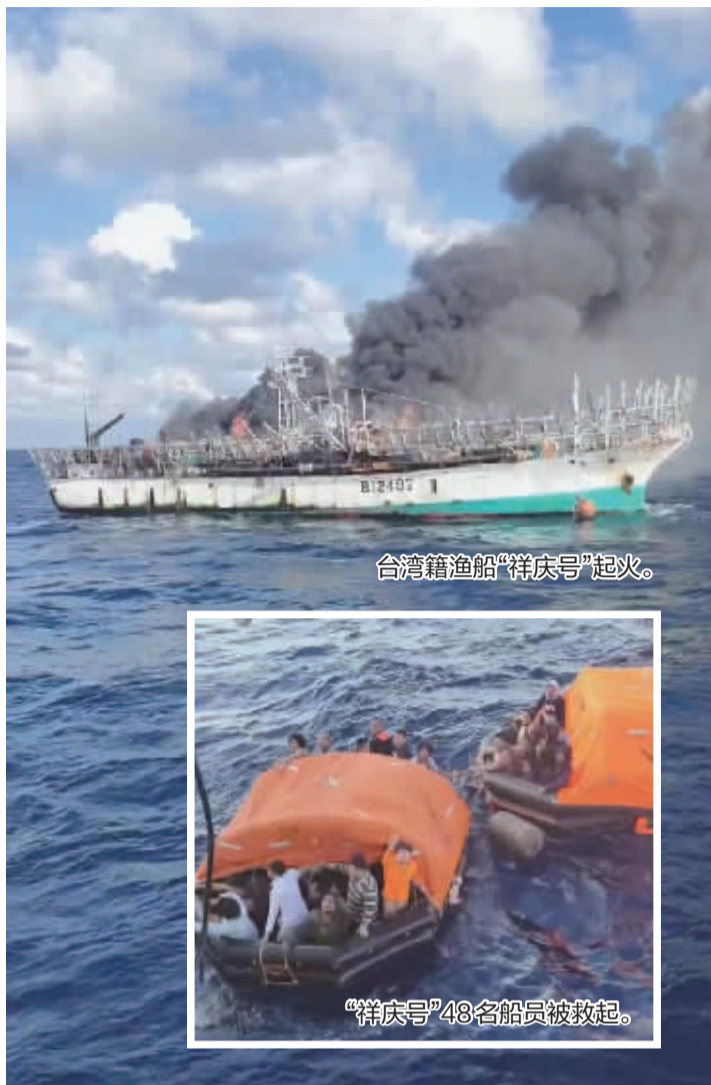
台湾籍渔船“祥庆号”起火。

记者从宁波市农业农村局获悉,11月6日北京时间10:10,宁波一远洋渔业公司下属一渔船,在北太平洋海域成功救起48名遇险的台湾籍渔船船员。