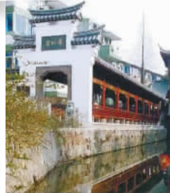
“镇海中学校园十景”实景与手绘