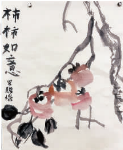
『柿柿』如意 海曙中心小学西校区203班 罗骏恺(证号2201455)指导老师 樊国明