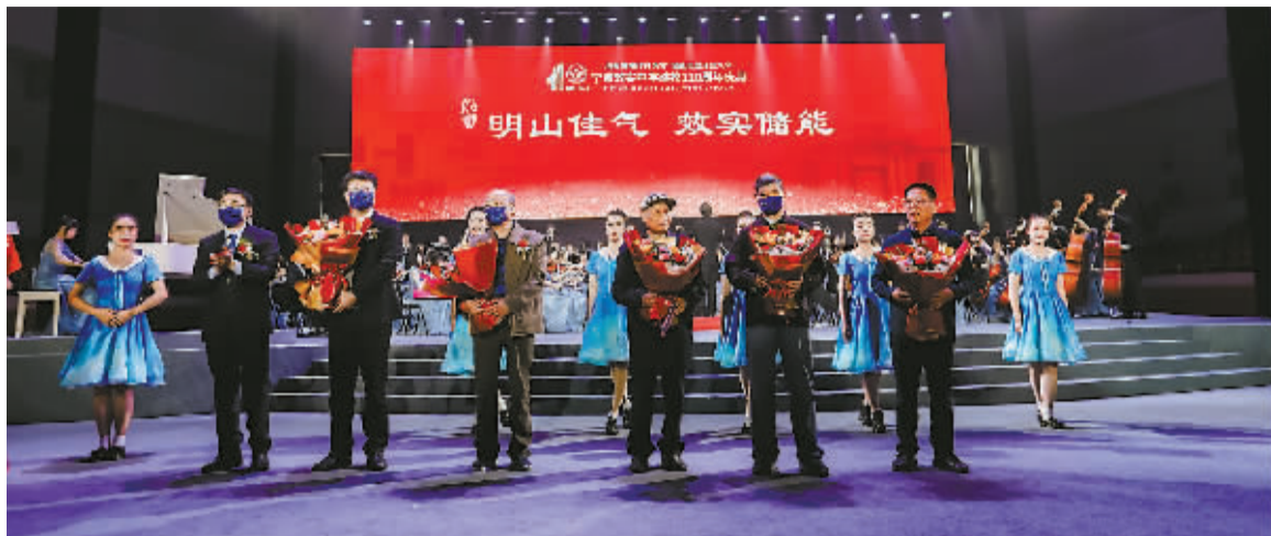
效实中学校庆典礼现场。

整场庆典以“培根铸魂作育英才 倍道而进开创未来”为主题，展示了学校110年来的办学成就和青年们对祖国蓬勃未来、母校灿烂明天的憧憬与期盼。