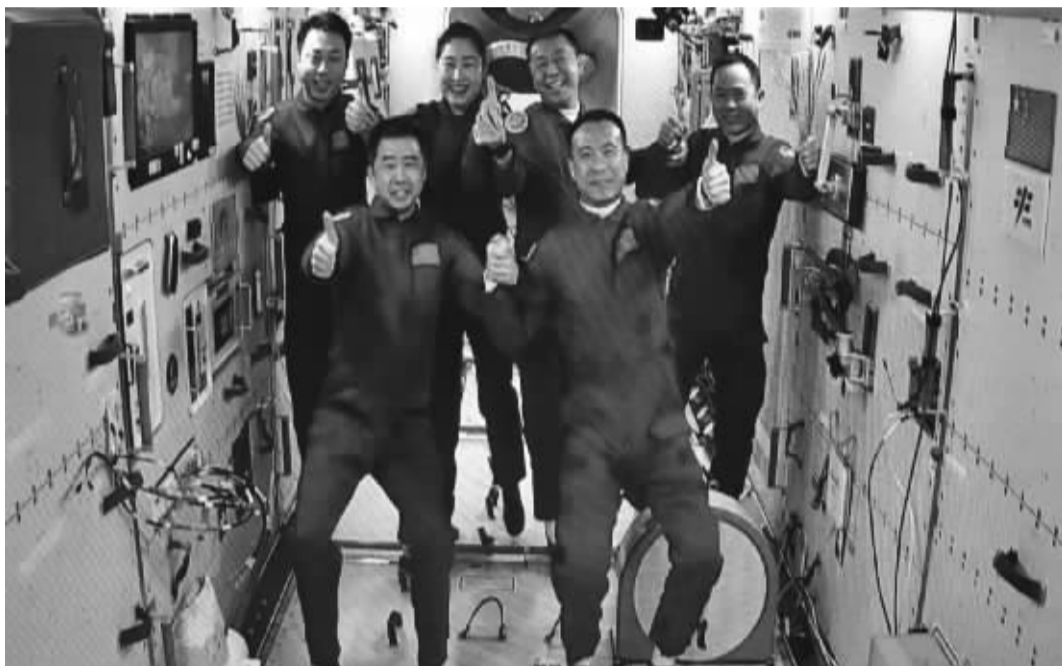
11月30日在酒泉卫星发射中心拍摄的神舟十五号航天员乘组与神舟十四号航天员乘组太空合影的画面。

中国第十艘载人飞船在极端严寒的西北戈壁星夜奔赴太空,神舟十五号航天员乘组于11月30日清晨入驻“天宫”,与神舟十四号航天员乘组相聚中国人的“太空家园”,开启中国空间站长期有人驻留时代。