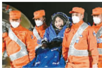
航天员刘洋安全顺利出舱。