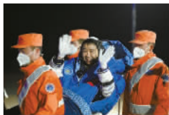
航天员陈冬安全顺利出舱。