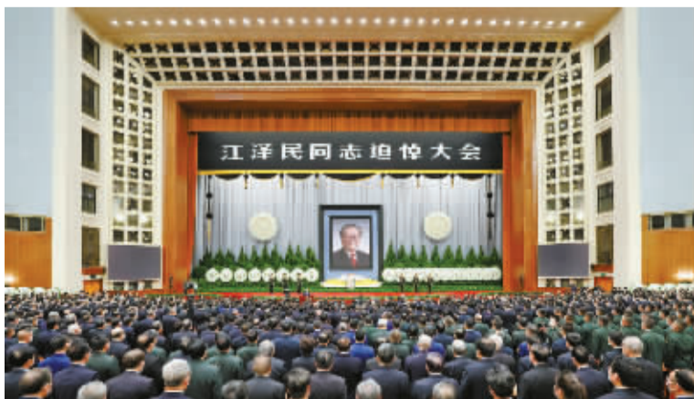
12月6日，中共中央、全国人大常委会、国务院、全国政协、中央军委在北京人民大会堂隆重举行江泽民同志追悼大会。新华社发