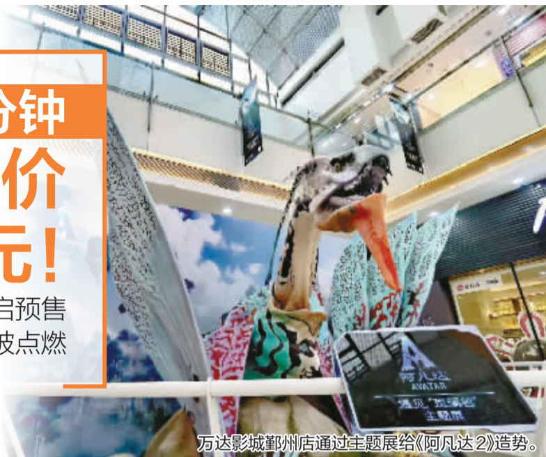
万达影城鄞州店通过主题展给《阿凡达2》造势。

12月7日中午,定档12月16日的电影《阿凡达2:水之道》(以下简称《阿凡达2》)开启预售,在24小时里拿下了超过5000万元的预售票房。作为今年压轴上映的进口大片,时隔12年重新回归的“阿凡达星人”,是否能够拯救寡淡了很久的大银幕,点燃国人的观影热情?