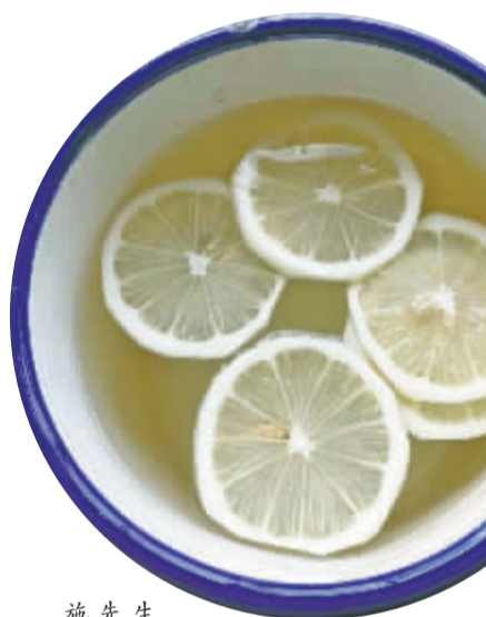
施先生喝的柠檬水。

随着防控措施逐渐调整，这一周以来，我们开始不断听说身边有人“阳了”。为了解感染新冠后真实的情况到底是怎样的，记者采访了医生、普通市民和一位居住海外的朋友，请他们聊聊自己的真实经历。