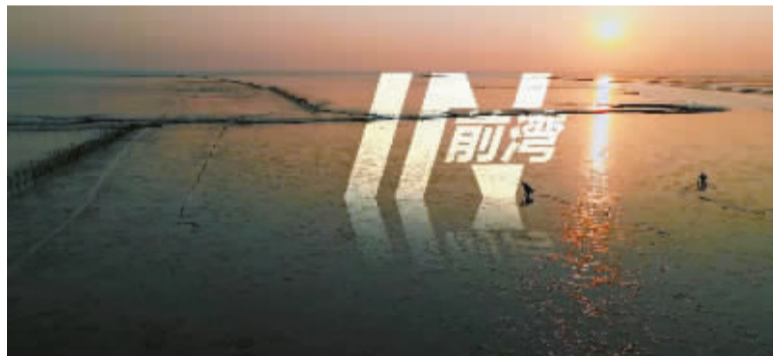
二等奖作品:《IN前湾》(作者:周驰、乐承斌等)

从获奖作品来看,本次大赛涌现了不少高水准的作品,题材类型丰富,涵盖了城市风光、湿地景色、汽车制造、人才创业、文旅产业等,短视频创作者通过自己独特的视角,以视频的方式深入挖掘前湾新区与众不同的气质,探寻前湾智造、产城融合、开放包容的前湾密码,用影像从多个维度讲述关于前湾的故事,呈现了来自五湖四海的年轻人在前湾发生的动人故事,展现了前湾朝气蓬勃的城市氛围。