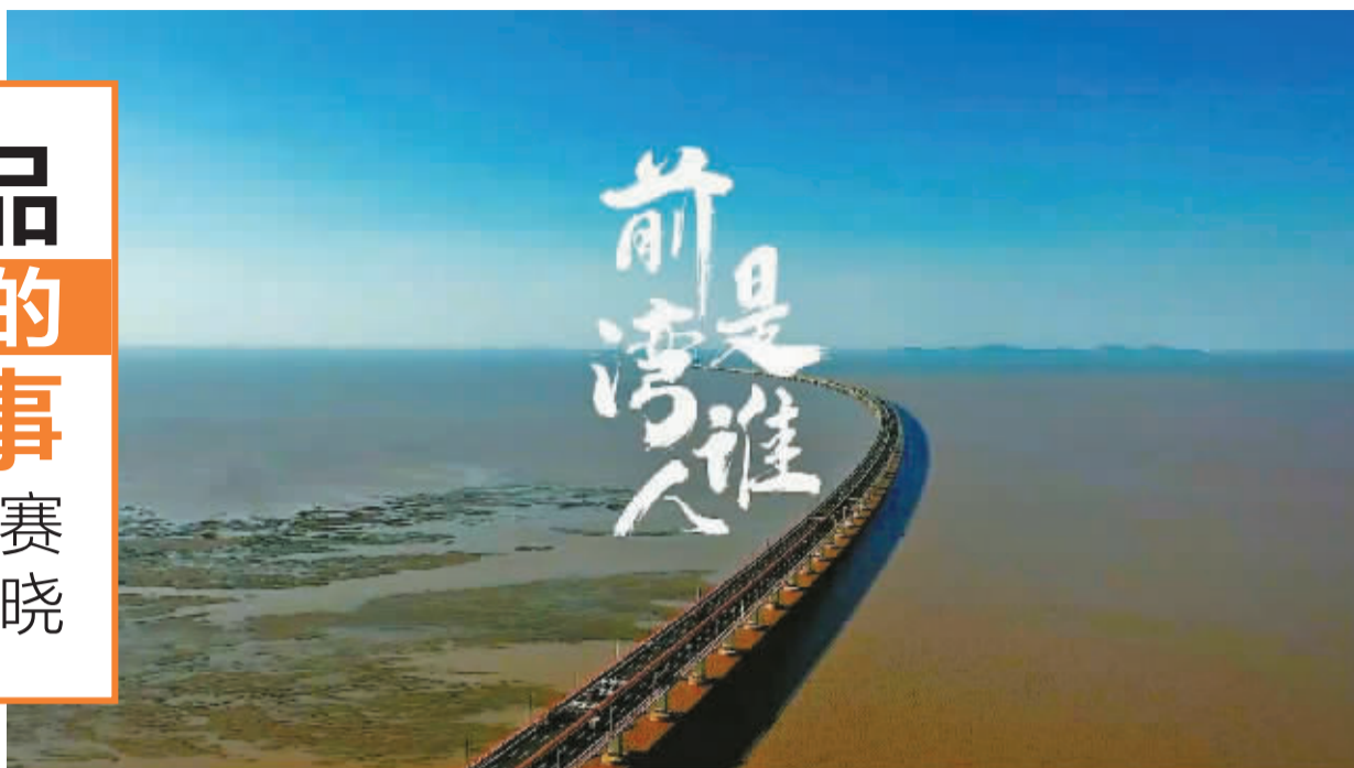
一等奖作品:《前湾是谁》(作者:徐盼盼)

在人人都是创作者的时代,每个人心中都有对美好生活的不同感悟,而短视频则成了许多人记录的方式之一。经过3个多月的征集,由宁波前湾新区新闻信息中心主办的“IN前湾”短视频大赛近日圆满收官。比赛吸引了全市短视频创作者积极参与,共收到百余部作品。经评审组客观、公正的评选,从中选出一等奖1个、二等奖2个、三等奖3个、优秀奖6个。