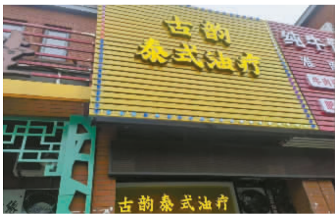
该地址又换了新的门头。

市民王先生2022年9月份在一家足浴机构充值3万元,仅仅消费了两次,店家就换了门头。这让他感到自己被骗了。他也希望通过自己的遭遇,让更多人小心提防,避免上当。