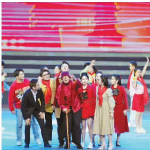
音乐短剧《回家过年》