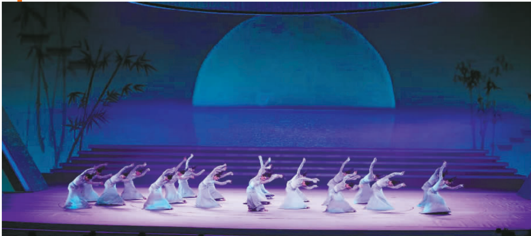
女子群舞《秘色宋韵》