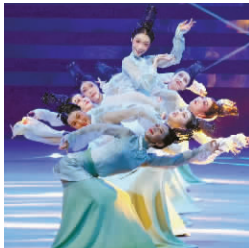
女子群舞《秘色宋韵》